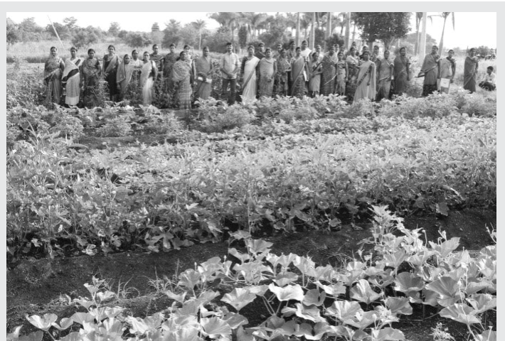
ਬਦਲਾਵ ਲਿਆਉਣ ਵਾਲੀਆਂ ਇਹ ਮਹਿਲਾਵਾਂ ਇਹ ਯਕੀਨੀ ਬਣਾਉਂਦੀਆਂ ਹਨ ਕਿ ਖੇਤੀ ਆਰਥਿਕ ਰੂਪ ਵਿੱਚ ਇੱਕ ਵਿਵਹਾਰਕ ਉੱਦਮ ਬਣ ਜਾਵੇ

ਇਸ ਮੂਲ ਆਧਾਰ ਦੇ ਨਾਲ, ਇਸ ਖੇਤਰ ਵਿੱਚ ਕੰਮ ਕਰ ਰਹੀ ਇੱਕ ਸੰਸਥਾ ਐਸਐਸਪੀ ਨੇ ਮਹਿਲਾਵਾਂ ਦੀ ਅਗਵਾਈ ਵਾਲੇ ਜਲਵਾਯੂ ਅਨੁਕੂਲ ਖੇਤੀ ਮਾਡਲ (ਡਬਲਿਊ ਸੀ ਆਰ ਐਫ) ਨੂੰ ਚਾਰ ਖੇਤੀ ਸੀਜ਼ਨ ਦੌਰਾਨ