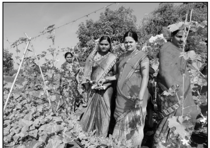
ਮਹਿਲਾਵਾਂ ਸੁਭਾਵਿਕ ਹੀ ਪਰਿਵਾਰ ਦੀਆਂ ਭੋਜਨ ਅਤੇ ਪੋਸ਼ਣ ਦੀਆਂ ਜ਼ਰੂਰਤਾਂ ਸਮਝਦੀਆਂ ਹਨ।

ਐਸਐਸਪੀ ਦਾ ਜਲਵਾਯੂ ਅਨੁਕੂਲ ਖੇਤੀ ਮਾਡਲ ਮਹਿਲਾਵਾਂ ਨੂੰ ਆਪਣੇ ਪਰਿਵਾਰਾਂ ਤੋਂ ਜ਼ਮੀਨ ਦੇ ਇੱਕ ਛੋਟੇ ਜਿਹੇ ਟੁਕੜੇ ਉੱਪਰ ਪਰਿਵਾਰ ਲਈ ਖੇਤੀ ਕਰਨ ਦੇ ਅਧਿਕਾਰ ਨੂੰ ਪ੍ਰਾਪਤ ਕਰਨ ਲਈ ਉਤਸ਼ਾਹਿਤ ਕਰਦਾ ਹੈ ਜੋ ਕਿ ਆਮ ਤੌਰ 'ਤੇ ਅੱਧੇ ਜਾਂ ਇੱਕ ਏਕੜ ਲਈ ਹੁੰਦਾ ਹੈ ਜਿੱਥੇ ਪਰਿਵਾਰ ਦੀ ਘਰੇਲੂ ਖਪਤ ਲਈ ਸਥਾਨਕ ਸਬਜ਼ੀਆਂ, ਮਿਲਿਟ, ਅਨਾਜ ਅਤੇ ਦਾਲਾਂ ਉਗਾਈਆਂ ਜਾ ਸਕਣ। ਇਸਦੇ ਨਾਲ ਹੀ ਇਹ ਮਾਡਲ ਦੇਸੀ ਬੀਜਾਂ, ਜੈਵਿਕ ਖਾਦਾਂ ਅਤੇ ਕੀਟਨਾਸ਼ਕਾਂ ਨੂੰ ਤਿਆਰ ਕਰਨ ਅਤੇ ਇਸਤੇਮਾਲ ਕਰਨ ਦੀ ਸਿਖਲਾਈ, ਯਕੀਨੀ